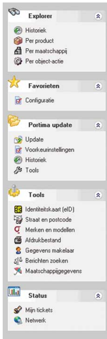
Afbeelding 2 : Het menu van AS/Web. Voortaan zijn alle functionaliteiten toegankelijk vanuit één enkel scherm.

Tot weldra dus, voor meer informatie over AS/Web.